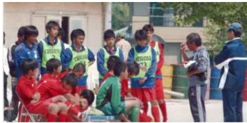
インターハイ予選での選手指導

サッカー協会ってどんな組織と聞かれます。一言で明確に答えることができない難しい質問です。ただ言えることは、協会には理念やビジョンがあり、それを具現化するために活動をしている組織だということです。ビジョンの一部に、「サッカーの普及に努め、スポーツを身近にする」ことで、人々が幸せになる環境を作りあげることがあります。