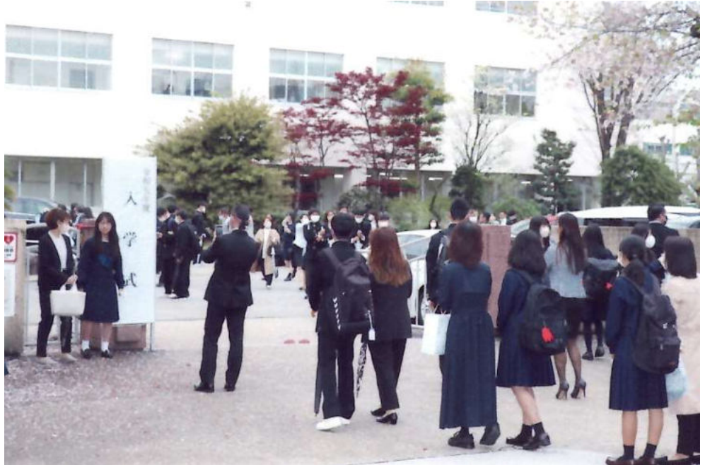
入学生の記念撮影風景 正門 (令和 5 年 4 月 6 日撮影)