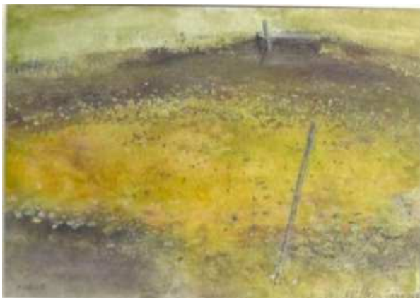
ため池の6月 (パステル画)