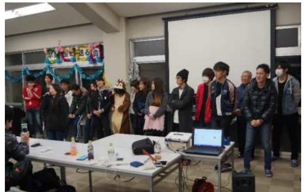
平成 29 年度 卒業生を送る会

卒業生を送る会では、卒業を間近に控えた生徒一人ひとりが「卒業生のことば」としてその思いを語ってくれます。昨年度の卒業生を送る会でも、多くの生徒が、「友達や先生に支えられたから頑張れた」「途中であきらめずに頑張ったよかった」と言っていました。また、昨年度実施したアンケートでも、「熱田高校定時制に入学して良かったと思う」という質問に対して、9割近くの生徒が「そう思う」「ややそう思う」と答えていました。