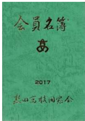
2017 版 12 月 発行