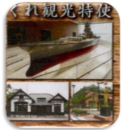
くれ観光特使拜命中