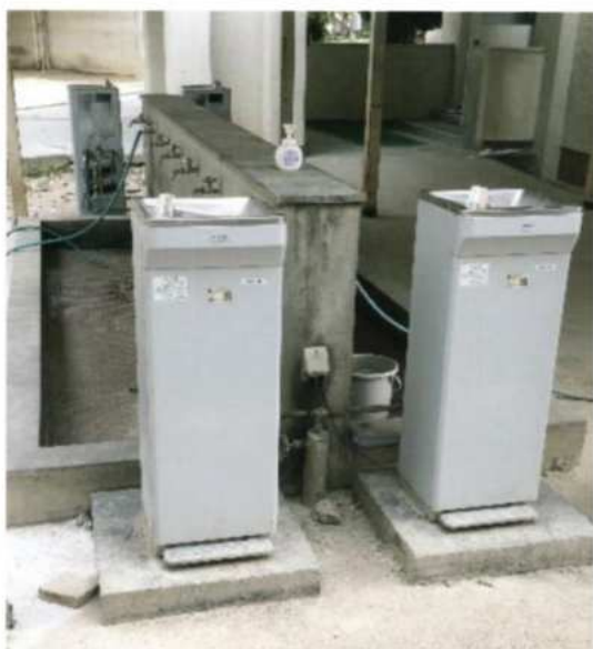
ウォータークーラー 5 台新調