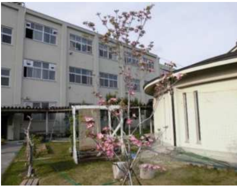
定時制創立 50 周年で同窓会より寄贈していただいたハナミズキ

「中学の時の私は、誰にも顔を見せたくなかったのと、表情で感情を読み取られるのがすごく嫌だったので、風邪を引いている訳でもないのに1年中マスクをつけていました。でも、このままでは私は変われないと思い、高校に入ってから思い切ったマスクを外しました。当時の私にとってマスクは外の世界から私を守ってくれる大切なものだったので、それが無いととても辛かったです。でも、マスクをつけたままだと自分の状態に戻ってしまいそうで、自分の逃げ道をなくすために外すことをきめました。」という彼女の言葉のような熱定での成長を応援していきたいと考えています。