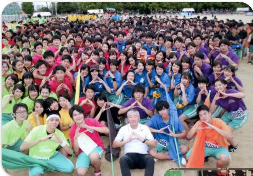
生徒に囲まれた北角校長

合唱曲ではなく合唱だと思えますが、合唱の完成度も高く、素晴らしいパフォーマンスでした。ただ、クラスによっては男子の声が小さく、ほとんど聞こえないところもあり、今年度は男子の全体的な頑張りを期待したいと思います。