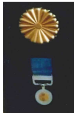
藍授褒章 (行政相談功勞) 受章日 (H. 27. 5. 15)

をし、総務省の行政相談委員を委嘱され、東欧電力事情視察団の一員となったことがきっかけで、『フォーラム・エネルギーを考える』(代表・神津カンナ氏)のメンバーとなり、緑区地域交通安全活動推進委員(公安委員会)や、ナゴヤ港活性化検討委員会(国交省)etc. をしてきました。